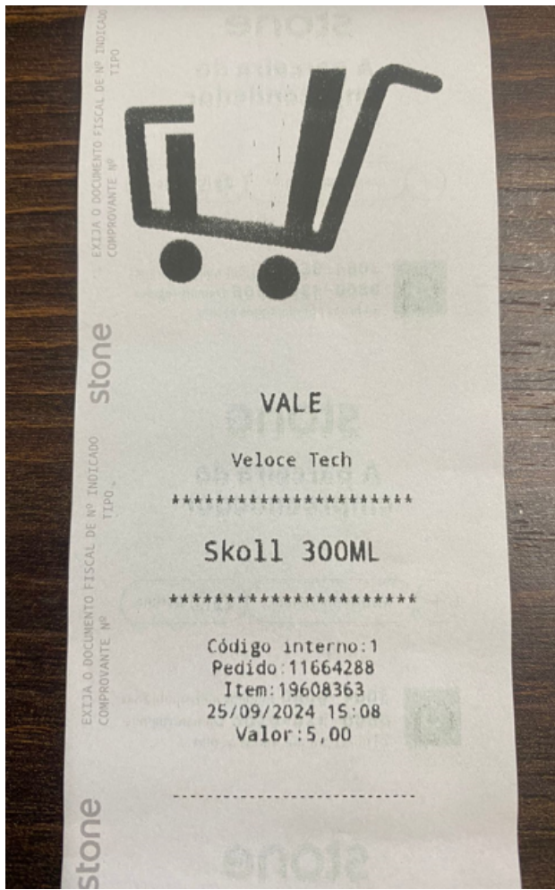
Vale/Voucher utilizando logo da empresa.