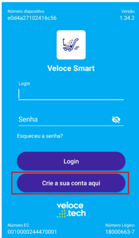
Tela inicial do aplicativo Veloce Smart